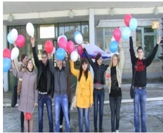
Крым! Мы с тобой!