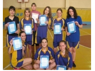
III место по баскетболу

В конце учебного года в Камышинском техническом колледже состоялся педагогический совет. На педсовете была дана оценка качества образовательного процесса, выявили отрицательные и положительные факторы.