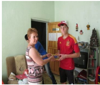
Спешите делать добро!