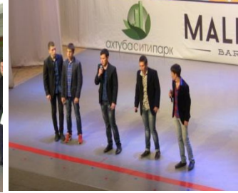
КВН в г. Волжском