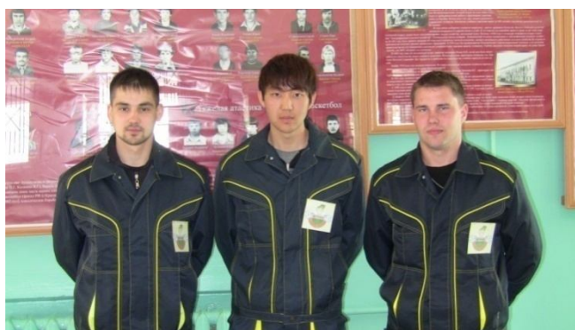
Команда КТК «Помеха справа»