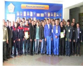
Автомобилист - 2014